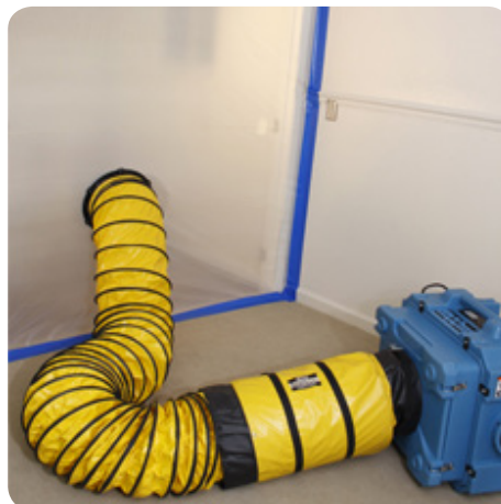
HEPA500 placeret udenfor det behandlede område og monteret med Ø305 mm Sto&Go-slange.