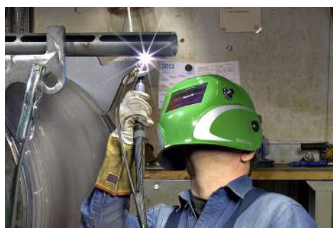
Focus TIG 161 DC HP PFC klarer alle reparationer